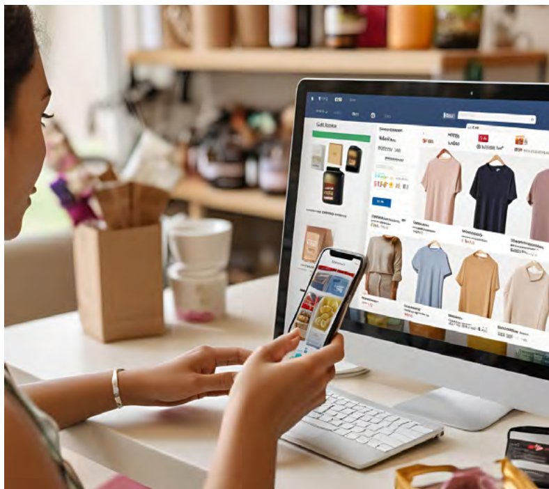
(pokr. na str. 2)

V tom hrají roli automatizované systémy a algoritmy pro řazení výsledků. To, jak tyto algoritmy fungují, je klíčové také pro podnikatele, kteří nabízejí své produkty prostřednictvím různých online zprostředkovatelských služeb.