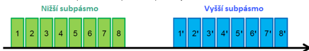
Obrázek 1: Schématické uspořádání kmitočtově duplexního pásma

V pevné službě nad 1 GHz se v převážné většině setkáváme s pásmy s kmitočtovým duplexním dělením. Takové duplexní pásmo je tvořeno spodním (nižším, též označovaným jako L ) a horním (vyšším, též označovaným jako H ) subpásmem. K příjmu signálů dochází vždy např. ve vyšším subpásmu, a k vysílání pak vždy v nižším subpásmu nebo naopak. Mezi těmito subpásmi je středová mezera tzv. center gap. Existují však kmitočtová pásma, kde je hodnota center gapu velmi malá, což může za určitých okolností vytvářet vyšší riziko vzniku rušení mezi prvním a posledním kanálem použitým na jednom stanovišti (zpravidla např. mechanismem svodu signálu, nežádoucím odrazem aj.). Schématické znázornění uspořádání duplexního pásma je uvedeno na obrázku č. 1.